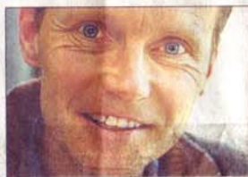
«Der Anteil von nicht-christlichen Gläubigen liegt heute in der Schweiz bei rund 5 Prozent.»

Baumann: Die Debatte zeigt, dass heute Dinge in religiöse Symbole hineininterpretiert werden, die nichts mit Religion zu tun haben. Soziologisch betrachtet können die Konflikte um Minarette – wie um andere religiöse Symbole – als Streit um gesellschaftliche Anerkennung einer religiösen Minderheit